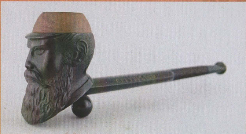
Dr. W.G. Grace Gutta percha pijp met bruyère binnen ketel